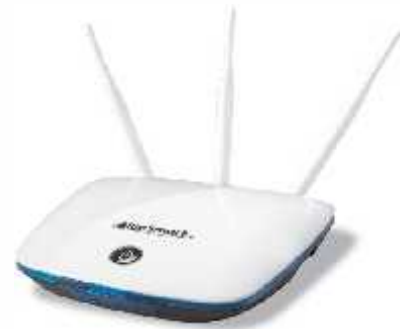
مدل سیلور بدون نیاز به کامپیوتر