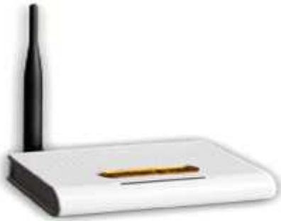
مدل برنز نیازمند به کامپیوتر